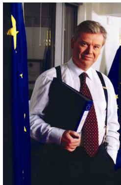
David Byrne Europese Commissaris voor Gezondheid en Consumentenbescherming