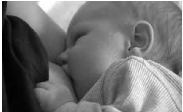
Beelden uit de video 'Goede zorg werkt, Unicef certificering in Nederland'