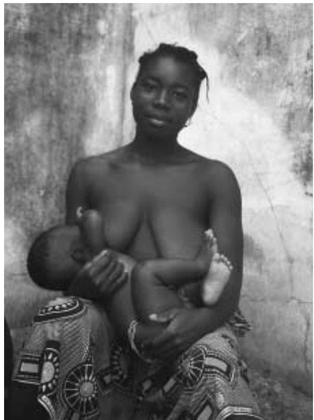
Moeder en kind 2002

tienerproject Jamaica Unicef, Maarten Bijl 070 333 93 33 www.unicef.nl