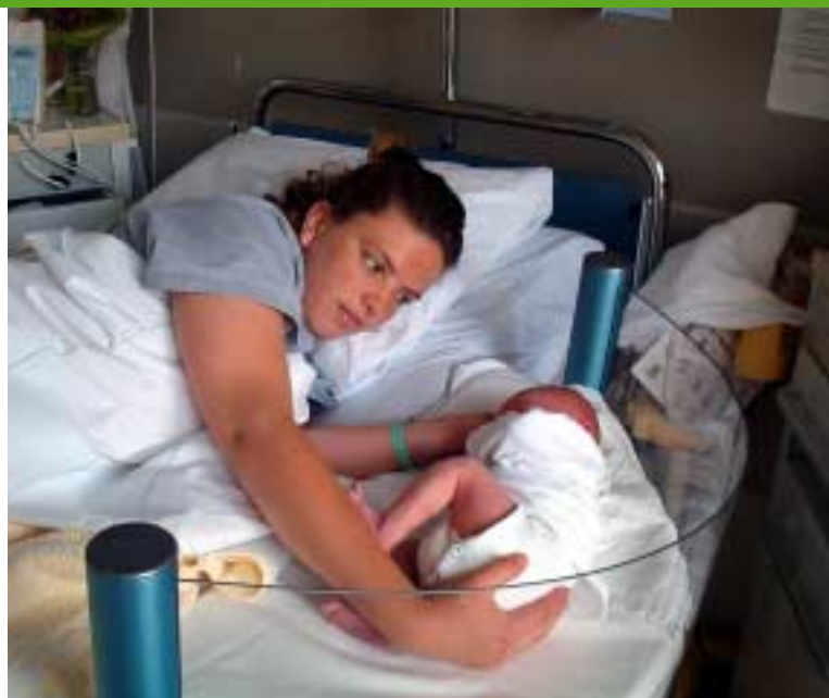
De 'clip-on crib'

Door het gezamenlijke streven naar het borstvoedingscertificaat is de samenwerking tussen de beide afdelingen beter geworden. Een voorbeeld: als het medisch verantwoord is, worden zieke baby's 's nachts bij hun moeder op de kraamafdeling gebracht voor de borstvoeding. Een paar jaar geleden gebeurde dat niet. De kraam- en de kinderafdeling streven ernaar om elkaar zo goed mogelijk te informeren over de moeder die op de kraamafdeling ligt en het kind dat is opgenomen op de kinderafdeling. Deze zaken zijn vastgelegd in het