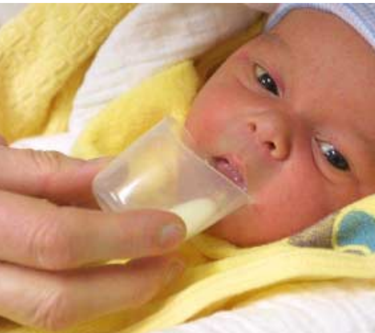
Moedermelk uit een kopje

Waar aandacht voor borstvoeding voorheen, met alle goede bedoelingen, toch min of meer aan de moeder en de welwillendheid van de individuele zorgverlener werd overgelaten, is het anno 2004 onderdeel geworden van een meer professionele zorgketen. Zo kan die zorg al vroeg in de zwangerschap beginnen om vervolgens via de bevalling en het kraambed in instellingen voor jeugdgezondheidszorg te worden voortgezet. En dat alles onder de paraplu van inmiddels geïnteresseerd geraakte zorgverzekeraars. Continuïteit van zorg is aldus gewaarborgd.