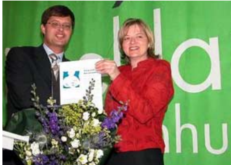
In juni 2004 heeft minister-president Jan Peter Balkenende het WHO/UNICEF certificaat Zorg voor Borstvoeding uitgereikt in het IJsselland Ziekenhuis

Borstvoeding is onbetwistbaar zo'n onderwerp; zeker als blijkt dat er handvaten liggen voor best practices. Ik had dan ook het genoegen om de projectgroep van de kinder- en kraamafdeling te ondersteunen. Het ging niet altijd even gemakkelijk; maar de kracht voor het slagen van het project zat hem met name in het enthousiasme van de groep, hetgeen nog altijd zo doorklinkt. Het leuke is namelijk dat met het behalen van dit certificaat blijkt dat we het nu nog beter willen gaan doen en een voorbeeldziekenhuis willen blijven om met andere collega's onze opgedane kennis te delen. Dit is nog maar het begin en het smaakt naar meer!"