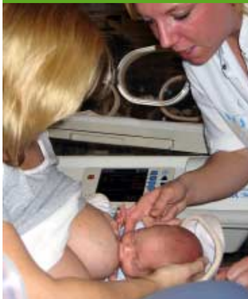
Couveusebaby aan de borst

rerend: kraamverpleegkundigen raakten geïnteresseerd in de speciale gedragingen van de prematuren en kinder- verpleegkundigen verdiepten zich in de foefjes bij het aanleggen kort na een sectio. Het bleek ook weer eens duidelijk dat een protocol pas echt gevolgd wordt als iedereen op de hoogte en overtuigd is van het 'hoe-en-waarom' van de regels! Dit komt iedereen, maar vooral ook de moeders en hun baby's, ten goede.